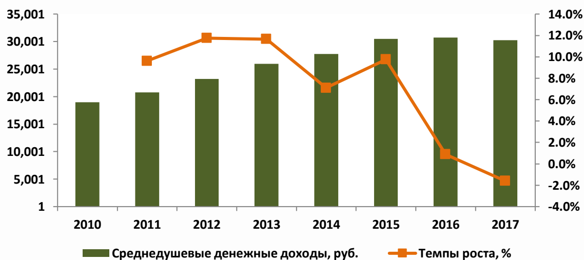
Рис. 2. Динамика среднедушевых денежных доходов населения, 2010-2017 гг., тыс. руб., %

За 2017 год сокращение реальных располагаемых доходов составило ....%.